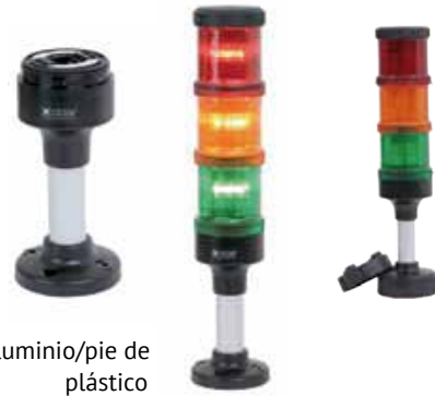
Aluminio/pie de plástico

Elevada protección IP 66 certificadas UL tipo 4/4X/13